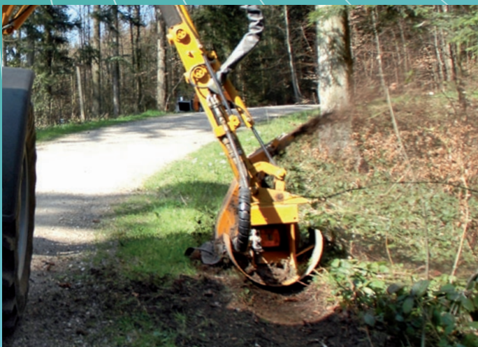
Auswurf des Fräsmaterials in den Wald ▲