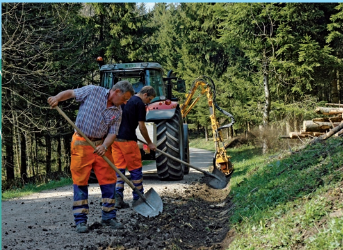
Fräsen einer Wasserführung ▲

hende, mit humoser Masse verstopfte Gräben lassen sich schnell und einfach nachfräsen. Über einen Auswurfkanal wird das ausgefräste Material zur Seite hin ausgestossen. Die Grabenfräse ist an einem Geräteträger angebaut und vom Fahrzeug aus bedienbar.