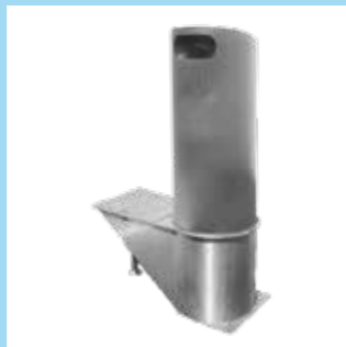
▲ Clean City 300 Liter Dank seiner geringen Einbautiefe geeignet für Standorte, an denen aufgrund von Rohren, Kanälen und Leitungen weniger Platz vorhanden ist.

Dank der intelligenten Kombination einer eleganten Abfalleinwurfsäule und einem im Boden versenkten Auffangbehälter gehören überquellende Abfalleimer und häufiges Abfallentleeren der Vergangenheit an.