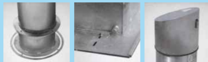
▲ Demontierbare Einwurfsäule mit Verschlussplatte ▲ Auftriebsschutz im Grundwasserbereich ▲ Abschliessbare Verschlusshaube